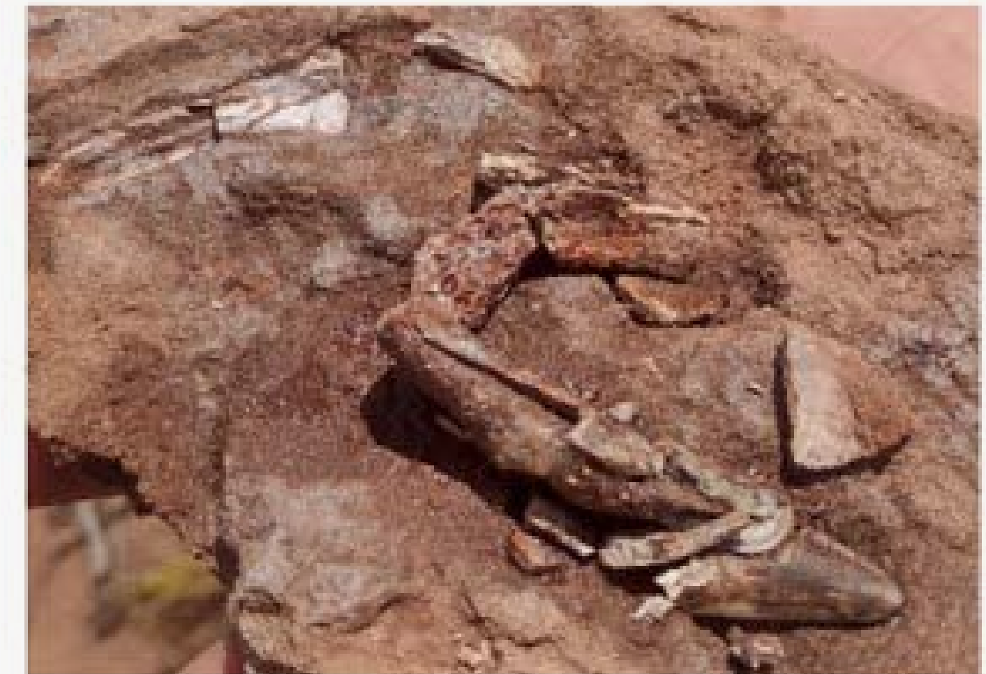
Foto 15. Restos de Crocodiliforme